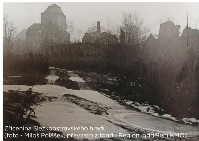
Zřícenina Slezskoostravského hradu

Znáte např. tu o tajemném pokladu a obávaném železném muži?